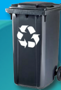
POJEMNIK NA ODPADY ZMIESZANE

Pojemniki a także worki z odpadami zbieranymi selektywnie należy wystawiać przed posesję lub bramę wyznaczonego dnia do godz. 7:00 (w okresie letnim do godz. 6:00), w miejscu dogodnym dla dojazdu samochodu, umożliwiającym ich odbiór przez pracowników. W przypadku stwierdzenia niezgodności zawartości pojemnika z deklaracją, wykonawca usługi zgłasza zaistniały fakt do Urzędu Miejskiego. Przyjazd samochodu z pracownikami i brak możliwości wykonania usługi będzie traktowane tak samo, jakby usługę wykonano.